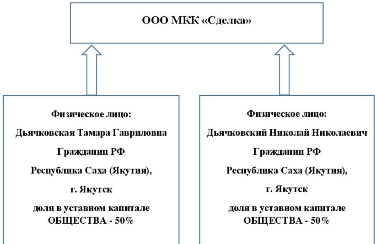
Схема взаимосвязей ООО МКК «Сделка» и лиц, оказывающих существенное (прямое или косвенное) влияние на решения, принимаемые органами управления ООО МКК «Сделка»

К Положению о раскрытии неограниченному кругу лиц информации о лицах, оказывающих существенное (прямое или косвенное) влияние на решения, принимаемые органами управления ООО МКК «Сделка»